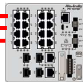
Stratix産業用 Ethernet スイッチ