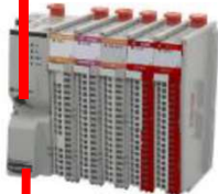
COMPACT 5000 安全リモートI/O