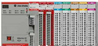
Compact GuardLogix 5380 SIL2/PLd